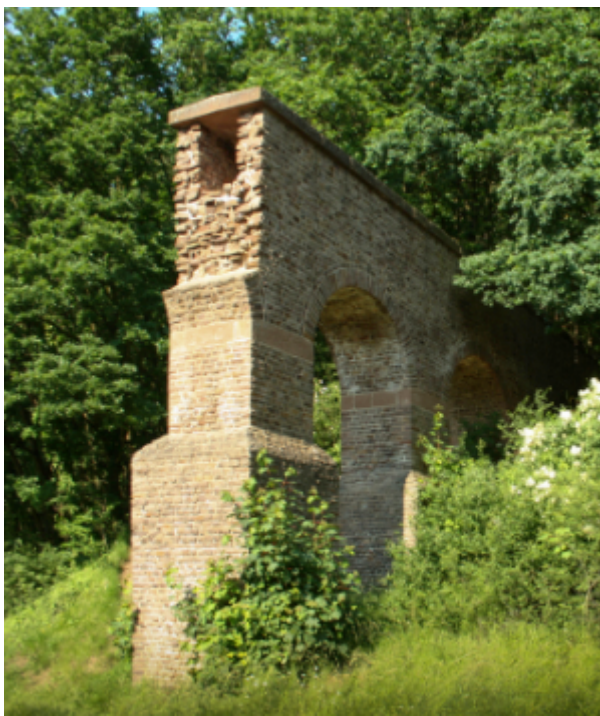
Aquädukt Mechernich-Vussemer

Prof. Grewe ist Vermessungsingenieur und arbeitete über 40 Jahre beim Rheinischen Landesmuseum. Schwerpunkt seiner Tätigkeit war die Erforschung der römischen Wasserleitungen und weiterer historischer, technischer Bauwerke im Rheinland.