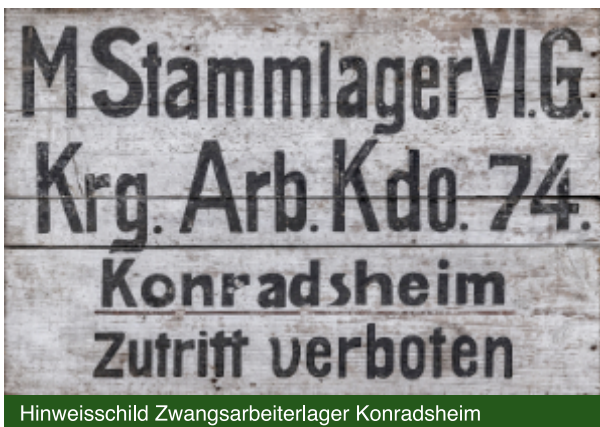
Hinweisschild Zwangsarbeiterlager Konradsheim