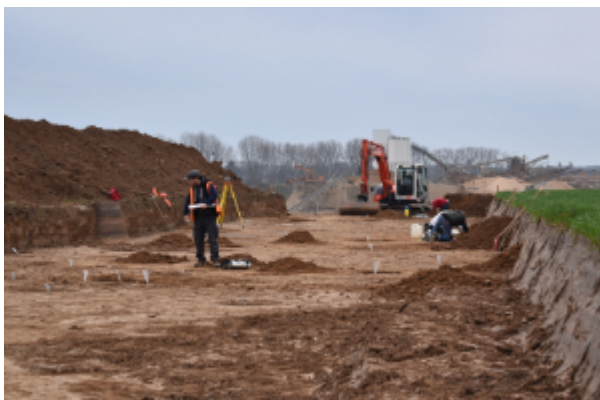
Archäologische Arbeiten im Vorfeld der Kiesgrube in Blessem im Jahr 2018

Die Aue der Erft und ihre angrenzenden Flächen boten den Menschen seit Jahrtausenden einen reichen Naturraum zum Siedeln und zur Landwirtschaft. Doch auch als Verkehrsraum, dem man folgen konnte oder der überwunden werden musste, spielt die mittlere Erft eine Rolle in der archäologischen Kulturlandschaft.