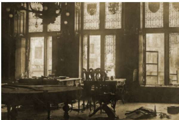
Verwüstungen im Aachener Rathaus nach der Erstürmung durch die Separatisten am 21. Oktober 1923