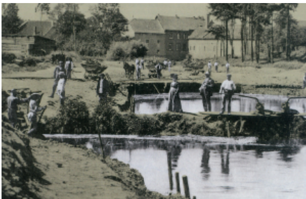
Erftausbau Morken Harff 1901