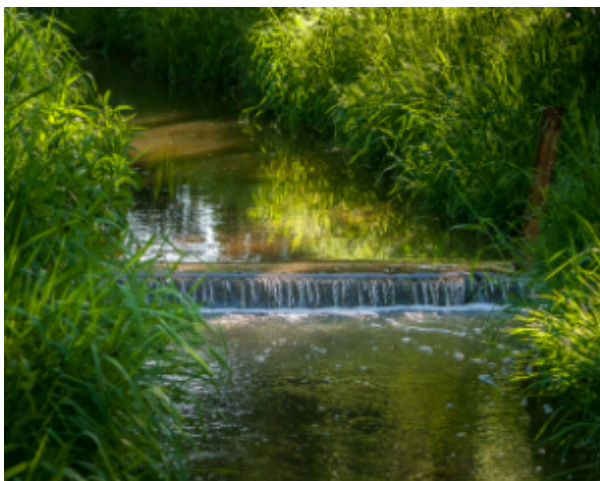
Mühlenbach am Stadtgarten

Sowohl die Erft und als auch der Rotbach werden durch einen Mühlenbach begleitet. Hier reihten sich im Erftstädter Gebiet über 13 Mühlen aneinander, die teilweise noch als solche zu erkennen, teilweise aber auch restlos verschwunden sind.