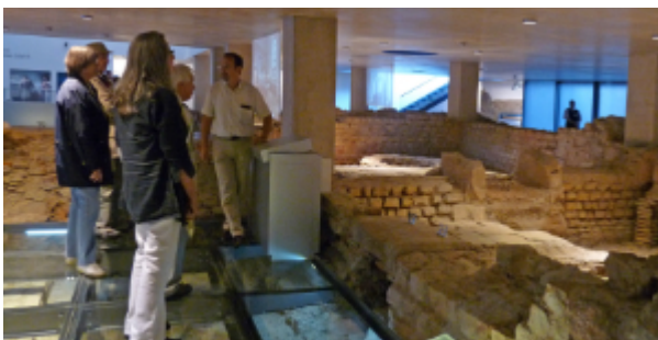
Römerthermen Zülpich – Museum der Badekultur

Das Museum der Badekultur in Zülpich zeigt die Kulturgeschichte des Badens. Ausgehend von der besterhaltenen römischen Thermenanlage ihrer Art nördlich der Alpen, schlägt die Ausstellung einen Bogen von der Antike bis in die Gegenwart. Eine anschauliche Inszenierung, verbunden mit interessanten Hintergrundinformationen, lädt zu einer ebenso informativen wie kurzweiligen Reise durch die Geschichte