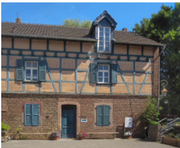
Gymnicher Mühle

Die Anreise erfolgt selbständig, Führungsbeginn 15:00 Uhr. Dauer ca. eine Stunde. Alternativ bieten wir die Anreise per Rad an mit kurzen Erläuterungen zum Gewässer. Start 14:00 Uhr Erftstadt-Lechenich, Mitfahrerparkplatz. Die Kosten für die Führung übernimmt der Geschichtsverein Erftstadt. Max. 20 Teilnehmer