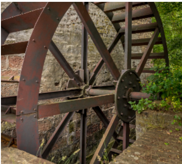
Wasserrad Gymnicher Mühle

Die Erft und ihre Nebengewässer boten eine gute Ausgangsposition für die Anlage von 75 Wassermühlen, von denen mehr als 10 im Gebiet Erfstadt zu verzeichnen waren. Über Bau, Funktionsweise, Zweck und Geschichte der Mühlen berichtet der Vortrag.